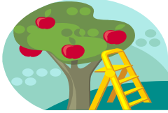
Las personas recogen las manzanas.