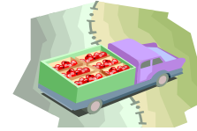
Los camiones llevan las manzanas a la tienda.