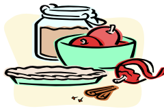
La madre prepara el pastel