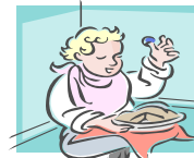
Los niños comen el pastel.