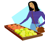
La madre compra las manzanas y otros ingredientes para el pastel.