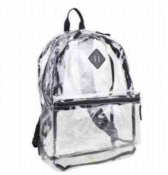
Ejemplo de mochila transparente permitida

Manual del estudiante 2018–2019: En un esfuerzo por mejorar las actuales medidas de seguridad, el CFISD exige a todos los estudiantes de las escuelas secundaria e intermedia que utilicen mochilas transparentes. Los estudiantes que participan en actividades extracurriculares tienen permitido cargar bolsos no transparentes para guardar los artículos pertinentes a su actividad en particular (por ejemplo: banda, deportes, etc.). Al entrar a la escuela, todos los bolsos de las actividades extracurriculares deben guardarse en los casilleros o en el área que haya sido asignada para tal fin. Todos los bolsos serán inspeccionados. Adicionalmente, el tamaño máximo de un bolso que un estudiante entre 6.º y 12.º grado podrá cargar durante el día, tal como lonchera, estuche para lápices, cartera, será de aproximadamente 6" x 9". Los estudiantes de escuelas primarias tendrán permitido seguir utilizando las mochilas tradicionales.