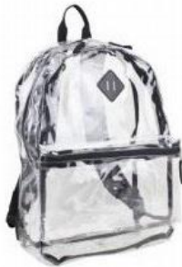
Ejemplo de mochila transparente permitida.

Manual del Estudiante 2018-2019: En un esfuerzo por mejorar las actuales medidas de seguridad, CFISD exige a los estudiantes de las escuelas secundaria e intermedia que utilicen mochilas transparentes. Los estudiantes que participen en actividades extracurriculares aprobadas por la escuela tienen permitido cargar con bolsos no transparentes para guardar los artículos pertinentes a su actividad en particular (por ejemplo: banda, deportes, etc.). Al entrar a la escuela, todos los bolsos de las actividades extracurriculares deben guardarse en los casilleros o en el área que haya sido asignada para tal fin. Todos los bolsos serán inspeccionados. Adicionalmente, el tamaño máximo de un bolso que un estudiante entre 6.º y 12.º grado podrá cargar durante el día, tal como lonchera, estuche para lápices, monedero, será de aproximadamente 6" x 9". Los estudiantes de escuelas primarias tendrán permitido seguir utilizando las mochilas tradicionales.